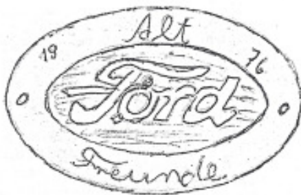
Logo 06 Vorschlag D. Nissen