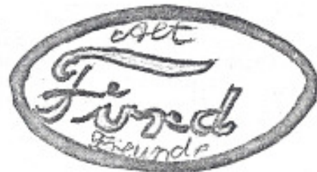
Logo 07 Vorschlag K. Frühbrodt