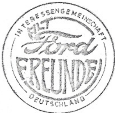
Logo 02 Vorschlag B. Meister

Es war als Denkanstoss gedacht um weitere Vorschläge aus den Reihen der Mitglieder zu erhalten. In einer der nächsten Ausgaben sollte dann eine Auswahl der Vorschläge gezeigt und zur Abstimmung aufgerufen werden. Die Ausgabe 1-77 der Alt-Ford-Nachrichten beinhaltet dann auch 8 neue Vorschläge