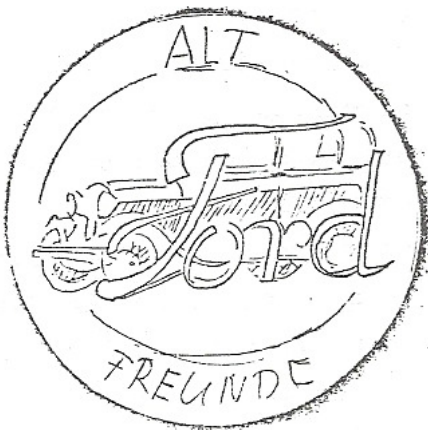
Logo 12 Vorschlag W. Winkelmann