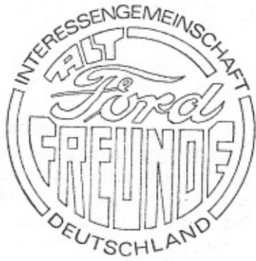
Logo 04 Vorschlag B. Meister