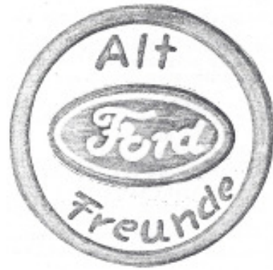
Logo 05 Vorschlag F. Grote