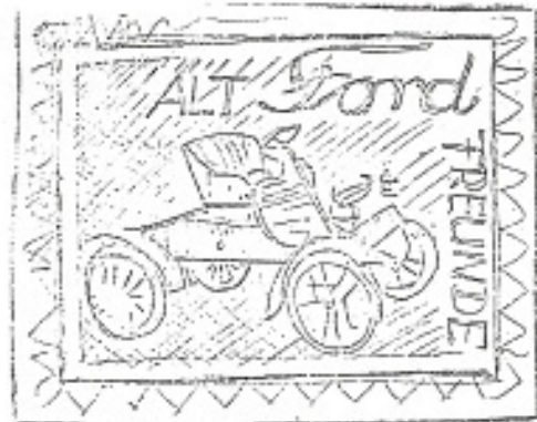
Logo 13 Vorschlag W. Winkelmann