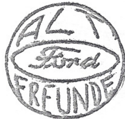
Logo 03 Vorschlag B. Meister