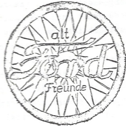
Logo 11 Vorschlag W. Winkelmann