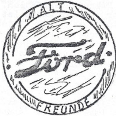
Logo – Vorschlag 01

Es war als Denkanstoss gedacht um weitere Vorschläge aus den Reihen der Mitglieder zu erhalten. In einer der nächsten Ausgaben sollte dann eine Auswahl der Vorschläge gezeigt und zur Abstimmung aufgerufen werden. Die Ausgabe 1-77 der Alt-Ford-Nachrichten beinhaltet dann auch 8 neue Vorschläge